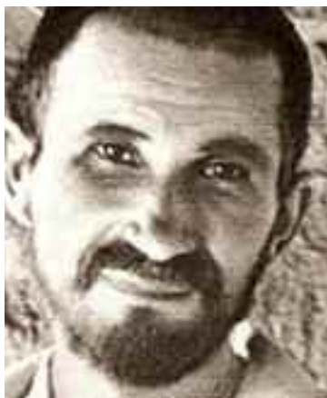
Foucauld: En su vida, sólo Jesús y los más pobres