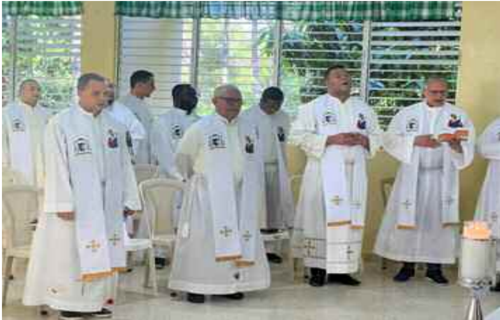
Parte del Clero de la diócesis que participó del retiro sacerdotal