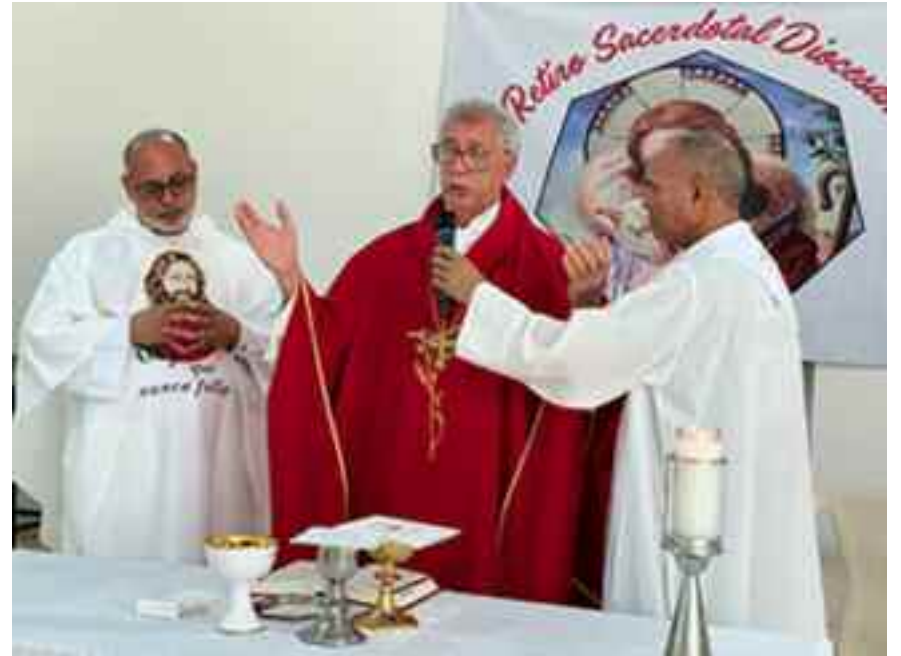
Mons. Diómedes Espinal presidió la Eucaristía

La Diócesis Mao-Montecristi realizó su retiro anual de sacerdotes, los días 14 al 18 de octubre, en el Seminario Ntra. Sra. de Las Mercedes, de Monción.