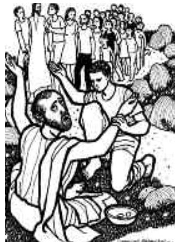
¡Levántate, Jesús te llama!

Hoy nos toca descubrir que ese ciego sentado al borde del camino es nuestra misma sociedad. Aquí no vemos cómo hemos acumulado una deuda tan grande. Al