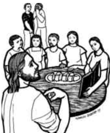
Yo soy el pan vivo que da la vida definitiva.

Creyendo en Jesús y participando en la Eucaristía parroquial, comunión real con Jesús, empezamos a vivir una vida nueva, la definitiva.