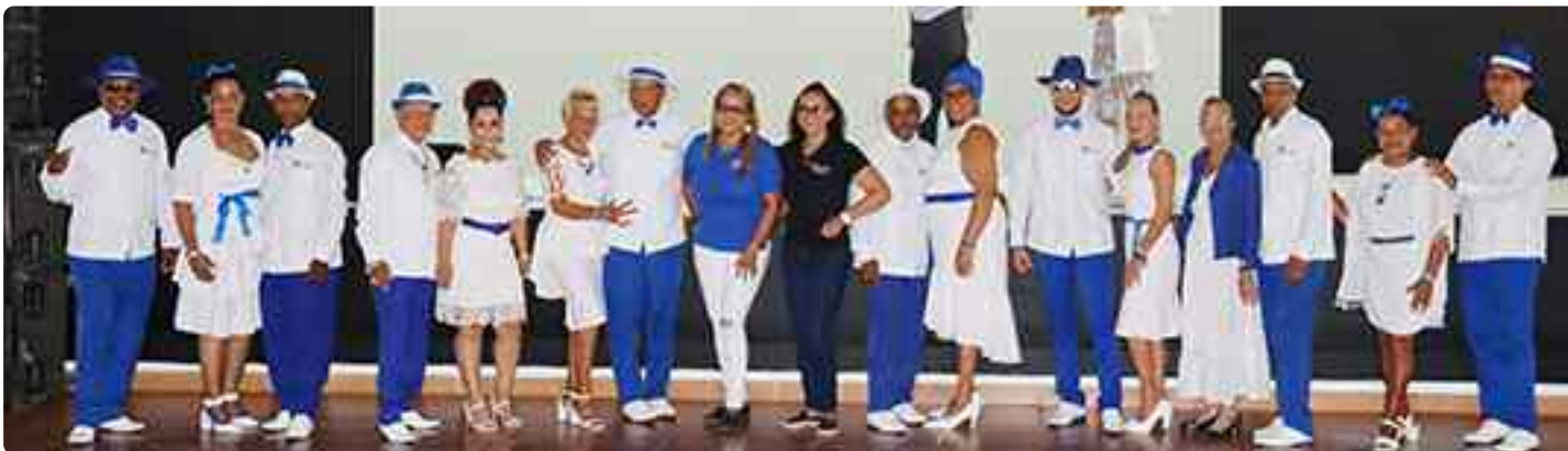
Son de Keka