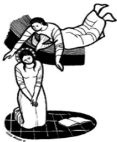
Dios escogió a una muchacha campesina.

La fuerza del Altísimo había prometido, que la relación entre Dios y el Mesías sería la de un Padre y un hijo. Esa promesa, se cumple en Jesús, Hijo de Dios, con una plenitud inconmensurable, ella nos alcanza a cada uno de nosotros.