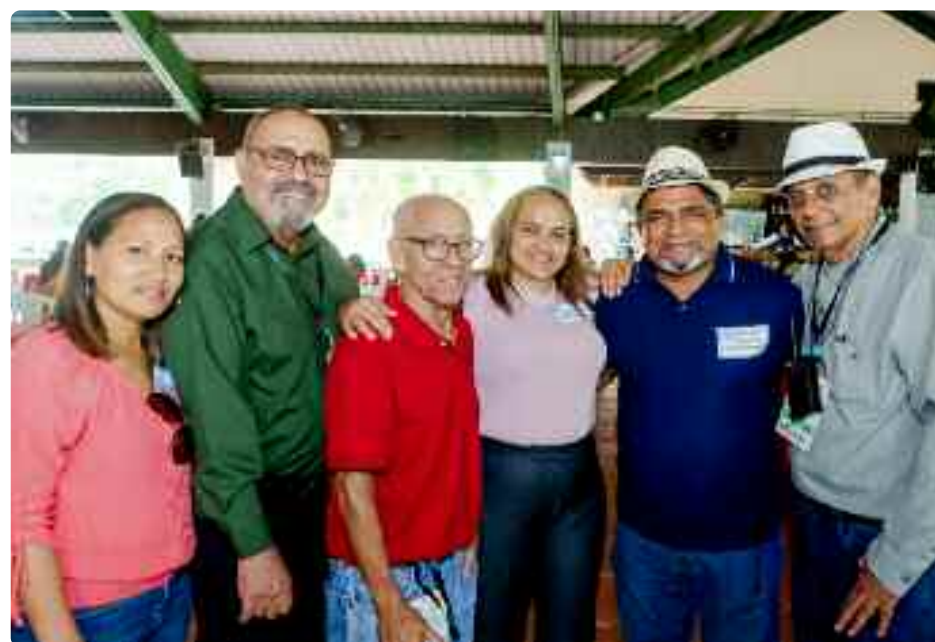
Personal de Radio Santa María