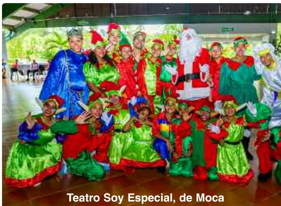
Teatro Soy Especial, de Moca

manos y los pies, invitando al amor de verdad, al compromiso por el futuro de nuestra familia y nación, a través de la edu-