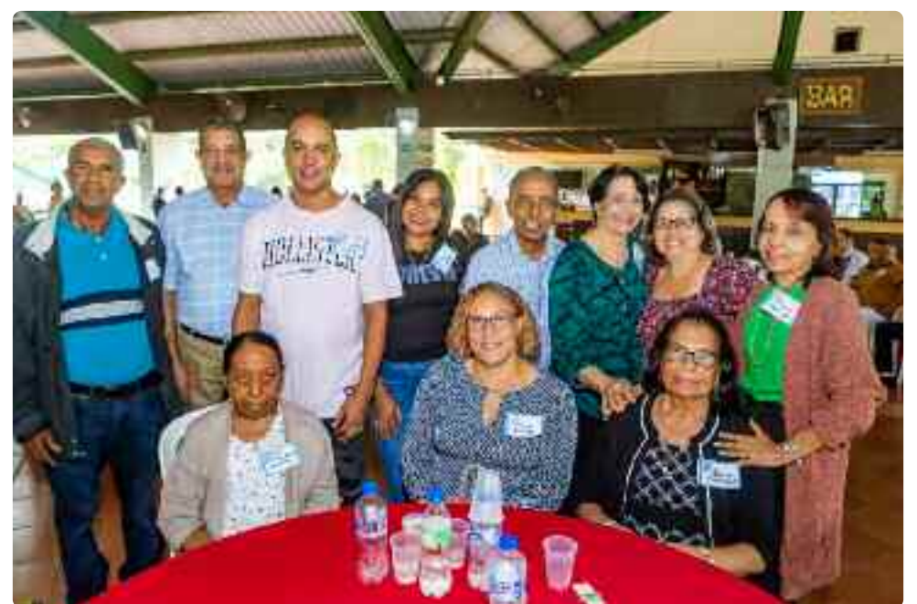
Fue un encuentro fraterno