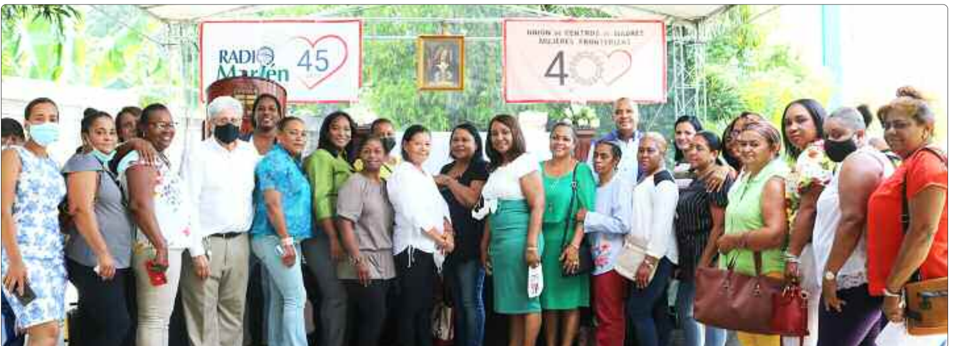
Representantes de la Unión de Centros de Madres Mujeres Fronterizas (UCMMF), con invitados a la celebración.

El calor no nos quitó el amor. Pudimos tener la Misa. Agradecer a Dios. Y pedir su gracia para poder seguir caminando y colaborando humildemente. Queremos llegar a