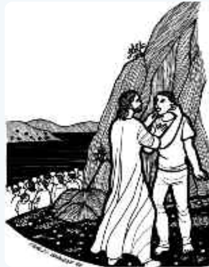
Lo llevó aparte y lo curó

Hay hombres y mujeres sordos, que no escuchamos lo que contradiga nuestro pensar, o nuestros intereses. Necesitamos escuchar los reclamos de los campesinos en parajes olvidados, o los de la madre soltera, mal pasando en un barrio con su niño enfermo. En muchos matrimonios, la mujer no tiene quien la escuche. Hay jóvenes aturdidos