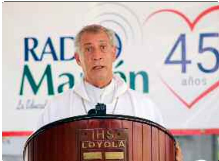
Monseñor Diómedes Espinal De León

los 50, y hasta a los 100 años, con Dios. Después del gran calor de la