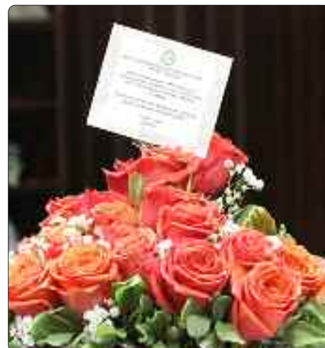
UTESA nos envió bellas flores