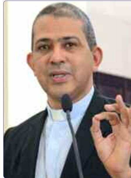
Mons. Tomás Morel Diplán

Ustedes saben que, en cuanto a vocación sacerdotal, nuestra Diócesis está viviendo buenos tiempos: en tres años he ordenado seis sacerdotes para la Diócesis de Baní. El número de seminaristas se mantiene alrededor de los veinte, más del doble con relación a los del 1999. He ordenado varios