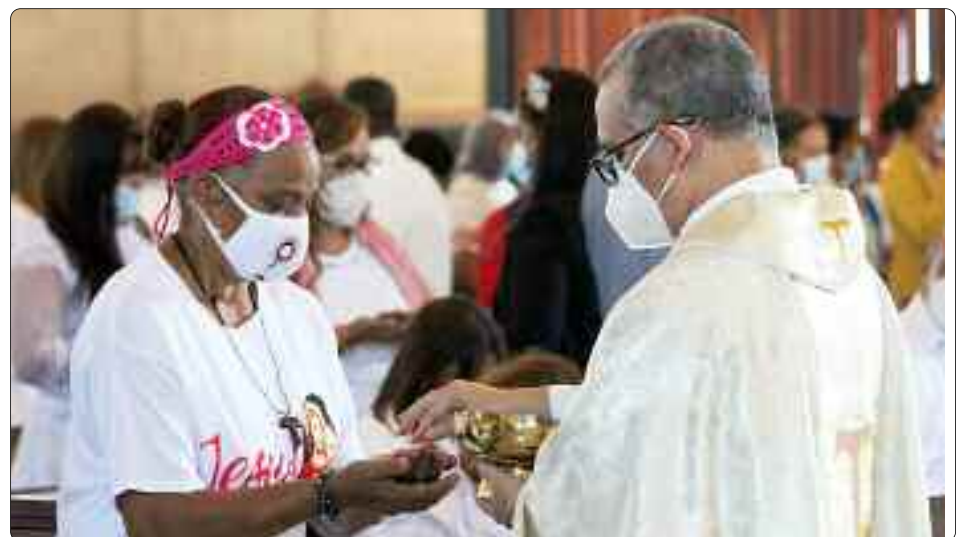
Laicado comprometido y devoto al comulgar