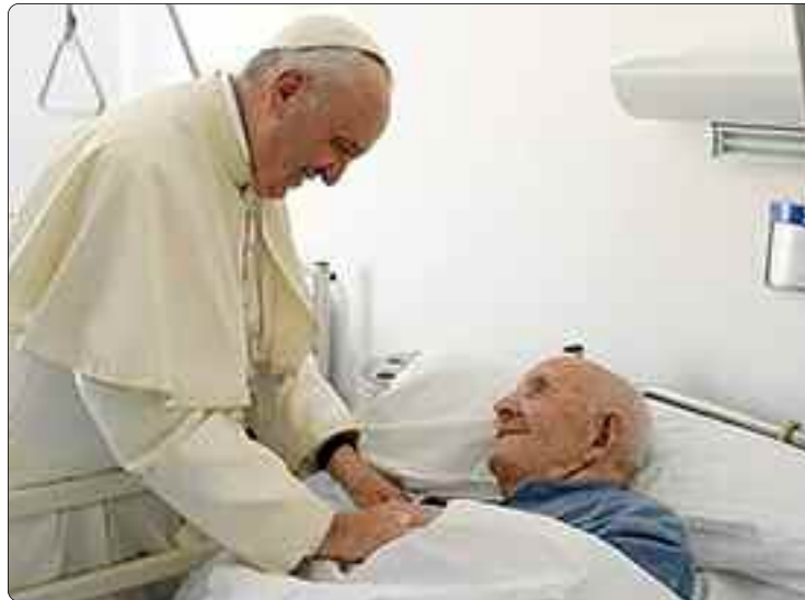
La Jornada Mundial del Enfermo también es una ocasión propicia para centrar nuestra atención en los centros de asistencia sanitaria.

El tema elegido para esta trigésima Jornada, «Sean misericordiosos así como el Padre de ustedes es misericordioso» (Lc 6,36), nos hace volver la mirada hacia Dios «rico en misericordia» (Ef 2,4), que siempre mira a sus hijos con amor de padre, incluso cuando estos se alejan de Él. De hecho, la misericordia es el nombre de Dios por excelencia, que manifiesta su naturaleza, no como un sentimiento ocasional, sino como fuerza presente en todo lo que Él realiza. Es fuerza y ternura a la vez. Por eso, podemos afirmar con asombro y gratitud que la misericordia de Dios tiene en sí misma tanto la dimensión de la paternidad como la de la maternidad (cf. Is 49,15), porque Él nos cuida con la fuerza de un padre y con la ternura de una madre, siempre dispuesto a darnos nueva vida en el Espíritu Santo.