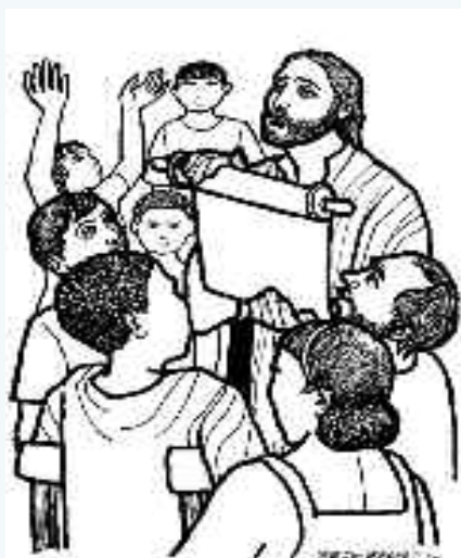
La palabra de Jesús es firme y veraz.

San Agustín, afirmó: “nadie creería si no juzgase primero que vale la pena creer”. El muchacho que se casa con una mujer se apoya en un conocimiento racional y una experiencia afectiva. A partir de su conocimiento de la muchacha, el muchacho elabora esta decisión: -- voy a apostarle a esta mujer mi vida --. Al casarse, el hombre y la mujer