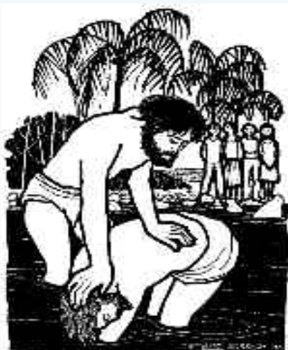
“Mi elegido a quien prefiero”.

Los primeros cristianos le aplicaron a Jesús los títulos del capítulo 42 de Isaías. Según ellos, Dios nombró a Jesús como “alianza de un pueblo y luz de las naciones”. Jesús estaba llamado a “abrir los ojos de los ciegos, sacar a los cau-