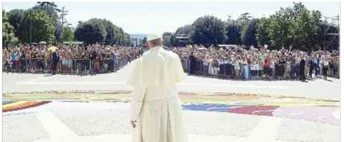
Papa Francisco en una visita Pastoral a Asís, Italia.

Los pobres también entregarán simbólicamente al Papa Francisco la capa y el bastón de peregrino, indicando que todos han venido como peregrinos al lugar de San Francisco, para escuchar su palabra.