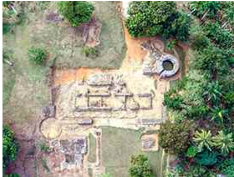
Ruinas de la Fortaleza de la Concepción de La Vega, desde el aire.

Conforme lo antes expuesto, han llevado a cabo un ambicioso programa de actividades que incluye conferencias virtuales, impartidas por especialistas, conocedores de la historia vegana y nacional, renovación de las promesas bautismales en las parroquias, tanto de consagrados como de laicos, jornadas misioneras orientadas a la formación bíblica, teológica y catequética en torno al significado e implicaciones del Sacramento del Bautismo, programas de difusión a