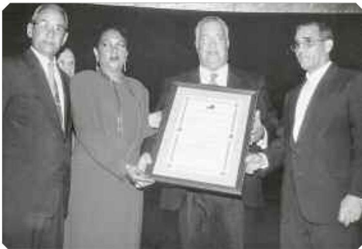
Los Alcaldes y los Regidores han sido siempre receptivos y buenos colaboradores de la Iglesia.