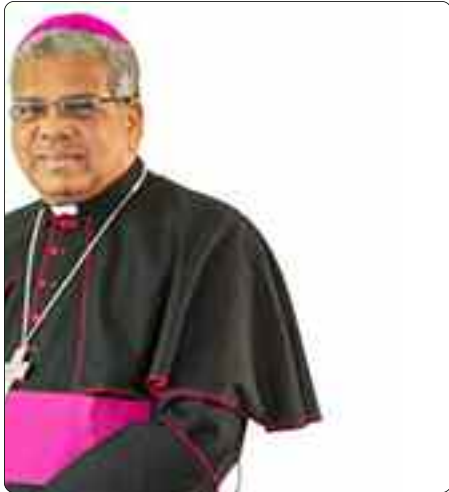
Monseñor Francisco Ozoria Acosta, Arzobispo Metropolitano de Santo Domingo

Del 7 al 13 de abril del año 2019 hice la visita Pastoral a la parroquia San Pio X del sector de Ciudad Nueva, en la Zona Colonial, dirigida por los Padres Carmelitas.