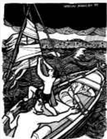
Las olas casi llenaban la barca de agua

La otra orilla: que los laicos y laicas asuman sus responsabilidades; que la Palabra sea la fuente de la