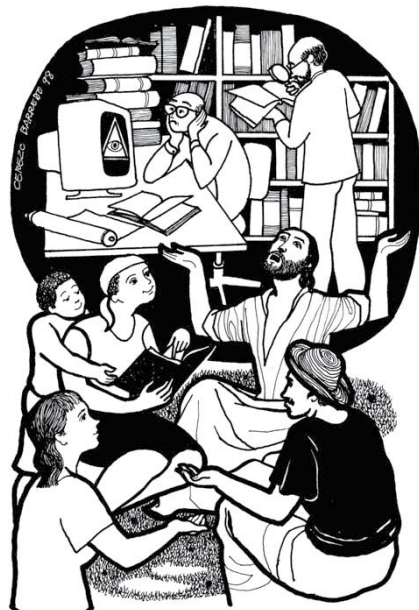
Jesús agradeció el saber de los sencillos.

La soberbia fatiga y mata, la mansedumbre descansa y da vida.