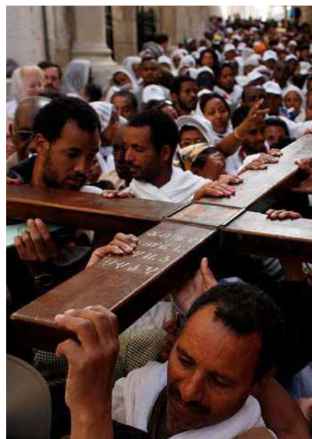
Levantar el país: cruz de todos

Así surgirá el consenso sobre la ruta a seguir. Entonces, juntos podremos echarnos al hombro la pesada cruz de este país pobre.