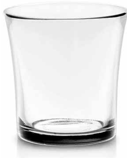
La transparencia se aclara ella mismita

Que todos los funcionarios declaren sus bienes con honestidad serrana y habremos dado un paso hacia la transparencia, base de la justicia y del orden que nos faltan.