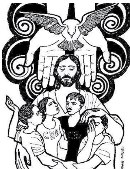
La Trinidad, un solo Dios por Amor.

En el Señor Jesucristo hemos experimentado el favor de Dios, la gracia, que nos abre al amor del Padre y nos vincula en la comunión del Espíritu Santo (2ª Corintios 13, 11 – 13).