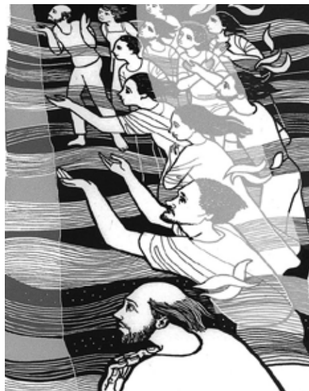
Recibieron un Espíritu de unidad

Con el Espíritu Santo se nos confiere a los creyentes la posibilidad de anunciar un mensaje que cada pueblo comprende en su propia lengua: la paz y la felicidad de todos son posibles si buscamos el bien común.