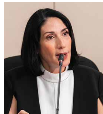
Raquel Arbaje, Primera Dama

Entre los objetivos específicos de la reforma se