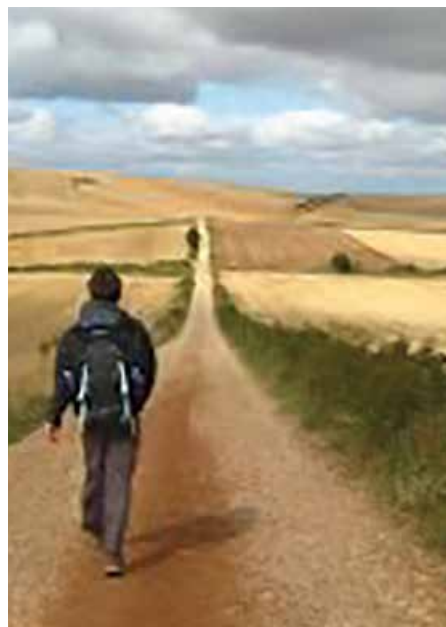
Yo soy el camino, la verdad y la vida.

Jesús se afirma como “camino, verdad y vida”. Eso quiere decir concretamente, que nuestra muerte en labios de Jesús es un caminar hacia el Padre; que en Jesús se nos revela la verdad sobre el destino humano y, finalmente, comprendemos que la vida verdadera, no es esta existencia agríndice a la que nos aferramos inútilmente, sino la vida que proviene del Padre y que Jesús resucitado ya vive.