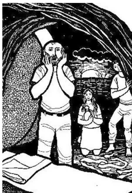
Entró, vio y creyó.

No diga que usted es creyente, pregúntese si usted cree, que desde Jesús para acá, muerte y maldad están desahuciadas.