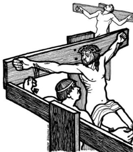
Desde la cruz, Cristo sigue creando transparencia

El Rey crucificado, nos enseña a cargar la cruz de una República diferente.