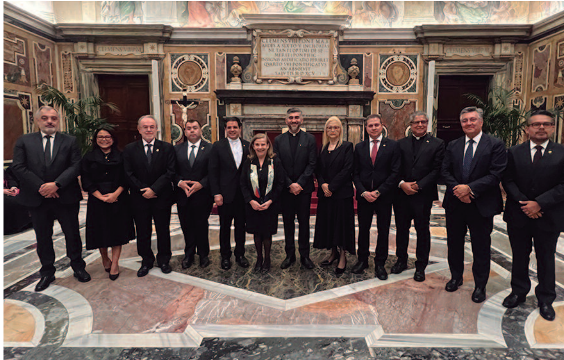
Miembros de la Junta Directiva de ODUCAL

El Papa llamó a fortalecer entornos académicos que acompañen a las nuevas generaciones en su formación intelectual, espiritual y humana, con una pedagogía que combine verdad, misericordia, responsabilidad social y visión trascendente.