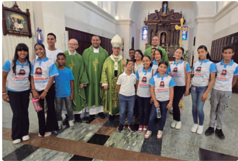
Integrantes del coro de la capilla Nuestra Señora de la Altagracia, Matanzas Adentro, Parroquia Jesucristo Redentor. Ellos cantaron en la misa del Jubileo de los Adolescentes en la Catedral Santiago Apóstol.