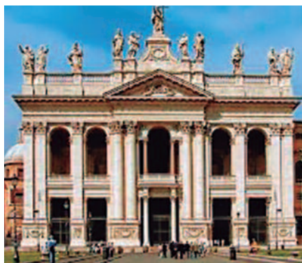
Los bautizados somos el templo de Dios

Ojalá los hombres y mujeres que buscan a Dios pudieran encontrarlo en nuestras vidas, valores, opciones y en nuestra Iglesia.