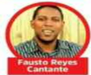
Fausto Reyes Cantante