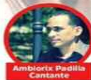
Ambiorix Padilla Cantante