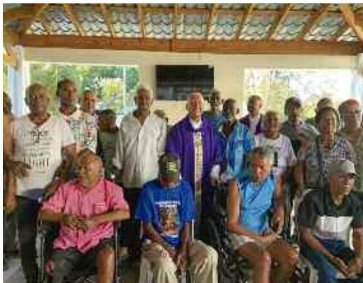
Mons. Andrés Napoleón Romero en compañía de los adultos mayores del nuevo hogar

La Diócesis de Barahona dejó en funcionamiento el hogar Nuestra Señora de la Altagracia que acogerá a adultos mayores. Está ubicado en la parroquia Nuestra Señora del Perpetuo Socorro, en el distrito municipal de Villa Central, Barahona. La apertura del Hogar se inició con la celebración Eucarística