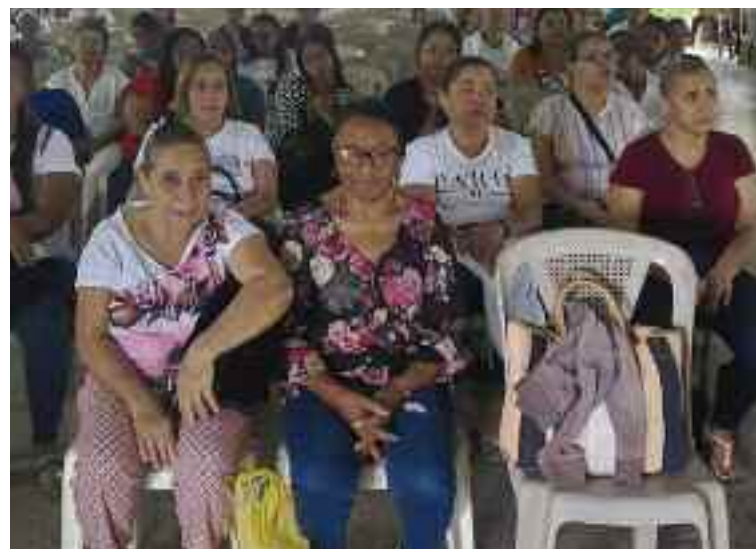
Feligreses de diferentes parroquias que se dieron cita en el Monte de Oración