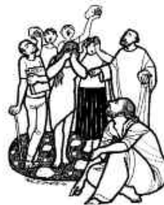
Jesús, un juez que devuelve a la vida

Pero Jesús la salva, primero sometiendo a sus acusadores a su propio juicio implacable: “aquél