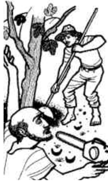
Cuaresma, urge cambiar desde adentro.

Los discípulos de Jesús se sienten bien seguros ante las desgracias que les han caído a otros: aquellos galileos asesinados por Pilato en el templo; los 18 que mató la torre de Siloé al