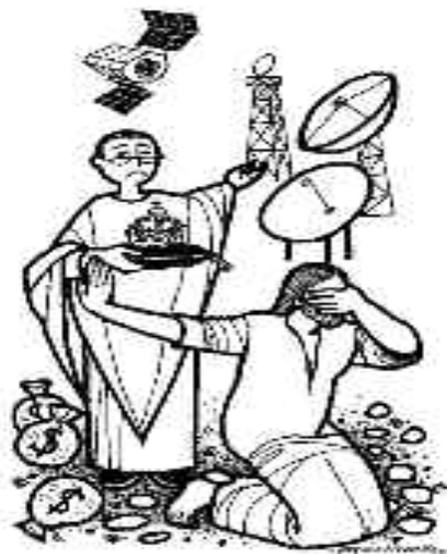
Jesús rechazó los falsos mesianismos.

El desierto de la cuaresma, camino hacia la Pascua de Jesús, ilumina el desierto de nuestras pruebas. Venceremos confiando en Dios que nunca defrauda (Romanos 10, 8-13).