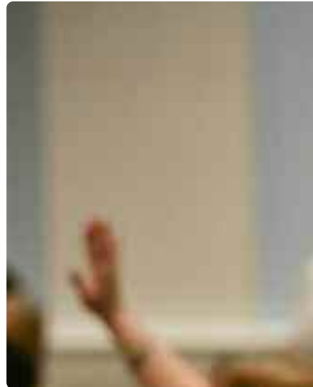
Los pueblos de América nos gloriamos de ser marianos, ¿cómo no hemos caído en cuenta todavía de

Los cristianos creemos que Jesús de Nazaret nos anunció el Dios Verdadero. Ese Dios está tan interesado en el bien de los demás, que lo antepone al culto. Jesús nos amonesta así: “Por eso, si tú estás para presentar tu ofrenda en el altar, y te acuerdas de que tu hermano tiene algo contra ti, deja allí mismo tu ofrenda ante el altar, y vete antes a hacer las paces con tu hermano; después vuelve y presenta tu ofrenda.” (Mateo 5, 23 – 24).