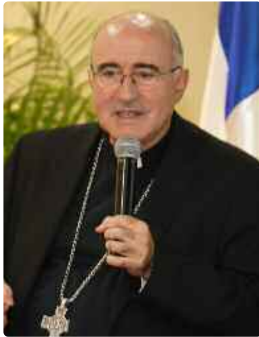
Daniel Fernando Cardenal Sturla Berhouet, Arzobispo de Montevideo.