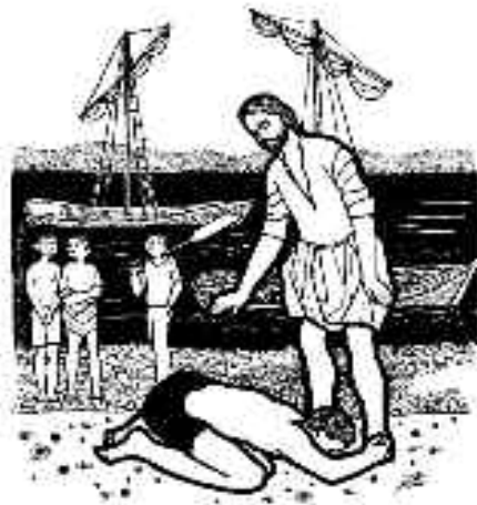
Serás pescador de hombres

Pero el verdadero desafío no viene de nuestra poca fe en el Señor, que nos impide remar mar adentro, el verdadero desafío viene de la sorprendente fe del Señor en Pedro y en nosotros: “desde hoy serás pescador de hombres”.