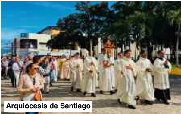
Arquidiócesis de Santiago