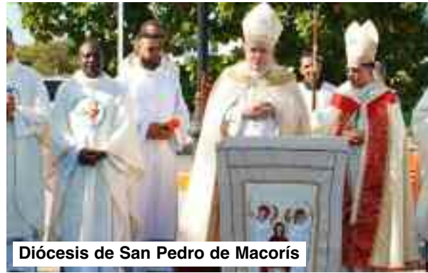
Diócesis de San Pedro de Macorís