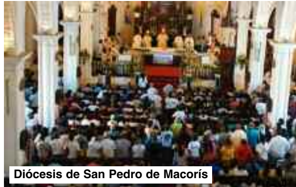
Diócesis de San Pedro de Macorís