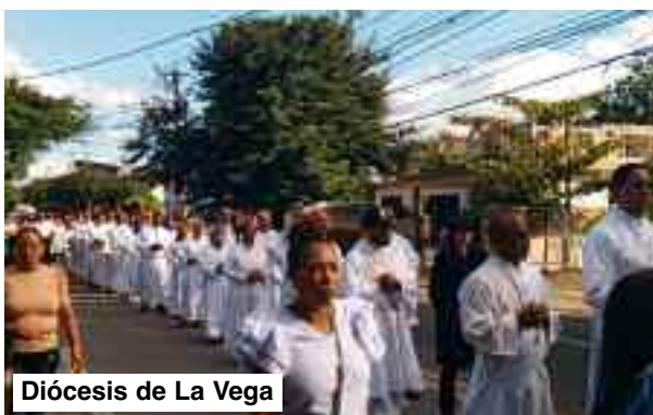
Diócesis de La Vega