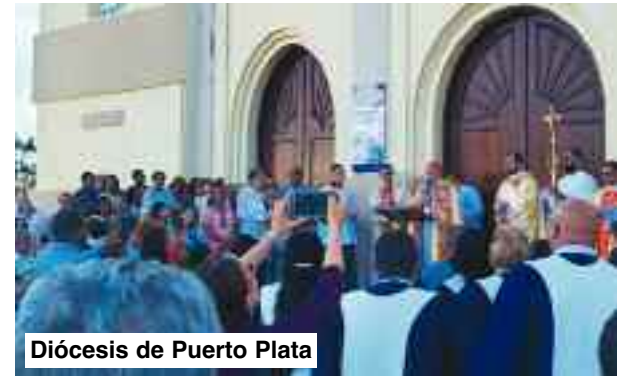
Diócesis de Puerto Plata