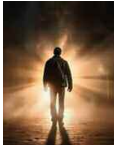
Caminemos el 2025 a su luz

nos comunica la Buena Noticia de que Jesús es la