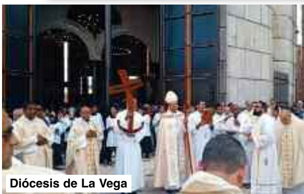
Diócesis de La Vega

Con la solemnidad que merece este acontecimiento, los Obispos, sacerdotes, diáconos y fieles, unidos como Iglesia participaron para renovar la fe, fortalecer la esperanza y caminar juntos como auténticos discípulos misioneros, iluminados por Cristo, la fuente inagotable de nuestra esperanza.