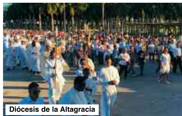
Diócesis de la Altagracia