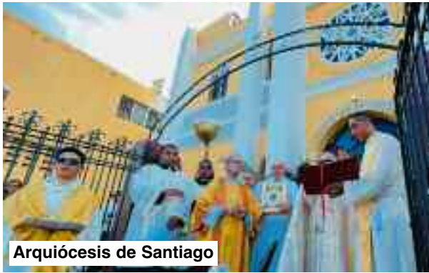
Arquidiócesis de Santiago