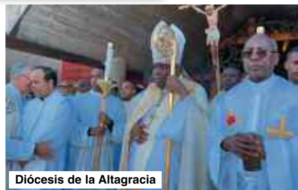
Diócesis de la Altagracia