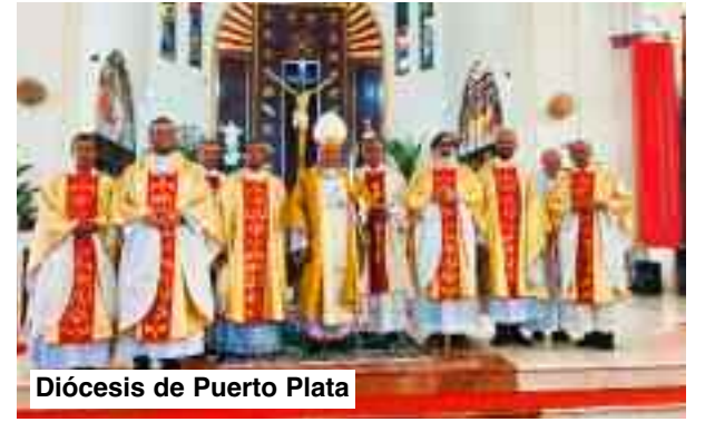
Diócesis de Puerto Plata