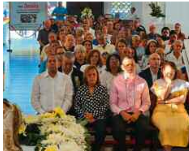
Autoridades municipales y fieles participando de la Eucarsitía

ago. La comunidad de Tamboril, en un noble gesto de desprendimiento, se desbordó en generosidad.