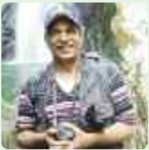
TEXTO Y FOTO: Juan Guzmán