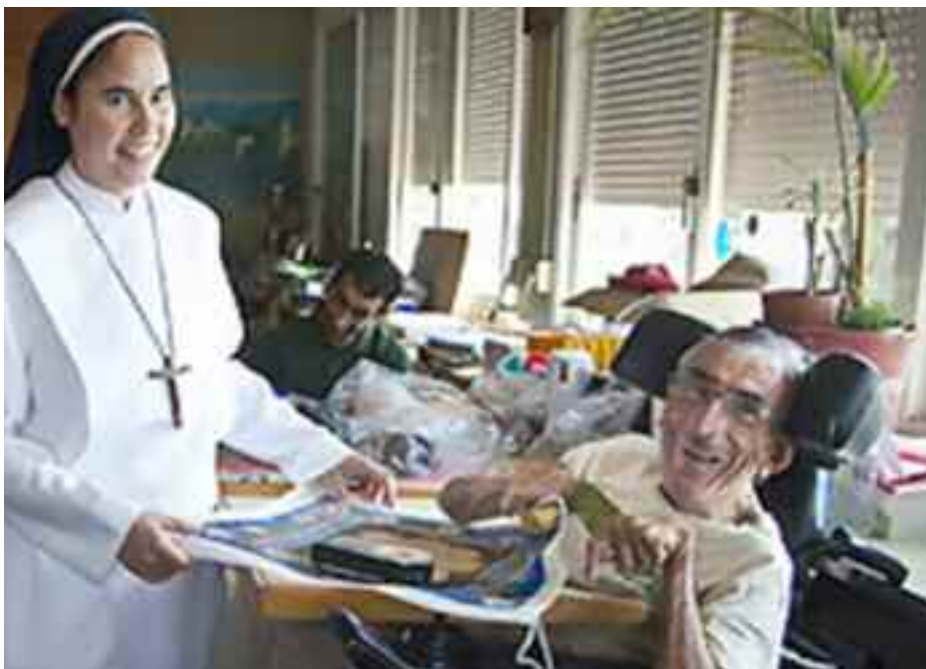
No he venido a ser servido, sino a servir.

¿Cuántos nos matricularíamos en esta extraña escuela de Jesús, “Academia: Ponte de último a servir”? Las mujeres y los hombres grandes han subido para servir. En los valles se destacan las palmas. En nuestra sociedad, la gente que ha servido. En cada corazón decente tienen una estatua.