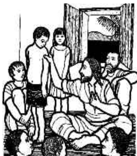
Puso al niño en el medio de sus discípulos.

Jesús ha hecho del niño nuestro maestro. ¡A la escuela, que ya es hora!