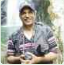
TEXTO Y FOTO: Juan Guzmán