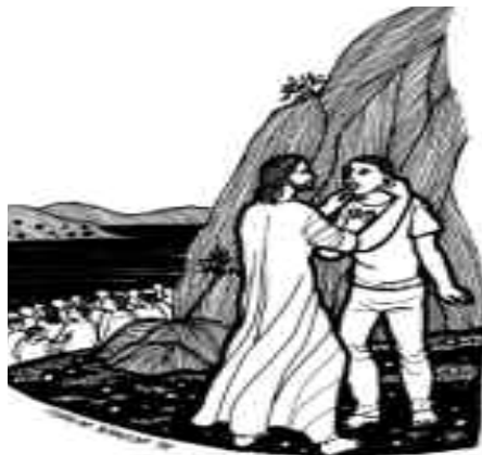
Lo llevó aparte y lo curó.

En todo bautismo, hay un momento en que el celebrante toca con sus dedos los oídos y los labios del bautizando, y haciendo suyos el gesto y la palabra de Jesús, exclama: ¡Effetá! ¡Ábrete! Así hemos de ser los creyentes: gente capaz de oír y destapar oídos cerrados; gente que pueda tomar y dar la palabra. Entonces realizaremos el mismo bien que hizo Jesús.