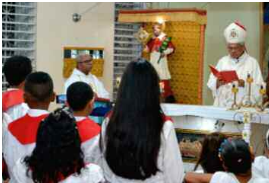
Mons. Francisco Ozoria, Arzobispo Metropolitano de Santo Domingo