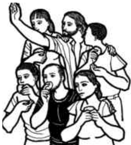
Un pan para caminar los caminos de Jesús.

En el evangelio de hoy (Juan 6, 51 – 58) Jesús nos invita a