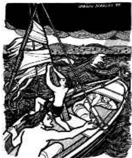
Las olas casi llenaban la barca de agua

La otra orilla: que laicos y laicas asuman sus responsabilidades; que la Palabra sea la fuente de la vida de la Iglesia; que interpretemos los signos de los tiempos, para servir con mayor lucidez, que podamos decir con verdad: “los gozos, las esperanzas, las tristezas y