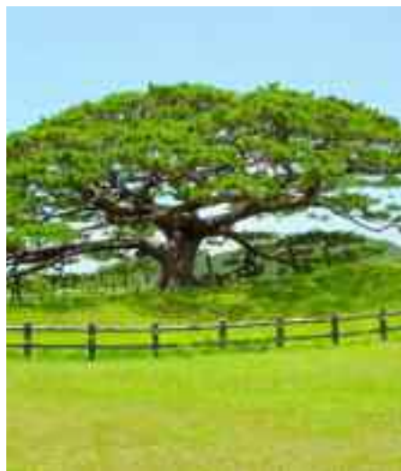
Los pájaros vienen y se cobijan en sus ramas.

En la Iglesia, necesitamos recordar, que la semilla del reino germina y crece sin que sepamos cómo. Nos aprovecharemos el no desanimarnos con los comienzos pequeños. Y hemos de cuidar que nuestras ramas sean acogedoramente espaciosas para que aniden en ellas nuestros queridos evaluadores.