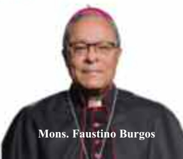
Mons. Faustino Burgos

canos. Confiamos que su esfuerzo por asegurar un proceso electoral transparente esté fuera de toda duda, tanto durante el montaje del evento, como en el momento del sufragio y durante el conteo de votos. Además, es importante que maneje con la mayor precisión y diafanidad posibles, los datos y el tiempo previsto para anunciar a los ganadores, evitando la ansiedad que produce la demora. Que ningún candidato se proclame ganador antes de ser anunciado por la Junta Central Electoral. Al mismo tiempo, instamos al respeto de las leyes que regulan las funciones y competencias de la Junta Central Electoral, y que aseguran un proceso jurídicamente ordenado y diáfano; y hacia las decisiones mayoritarias que se expresen en las urnas.