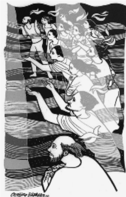
Las llamas se posaron sobre cada uno.

La lectura de los Hechos de los Apóstoles 2, 1 – 11 nos explica otras dimensiones de la acción del Espíritu al interior de los creyentes. Es como el aliento creador que sobre volaba las aguas del caos originario en Génesis (1, 2). El Espíritu recrea todo. El fuego de Dios, ya no está en el monte Sinaí (Éxodo 19, 18), sino dentro de los corazones de los creyentes para amar como Dios ama.