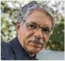
TEXTO Y FOTO: Juan Guzmán