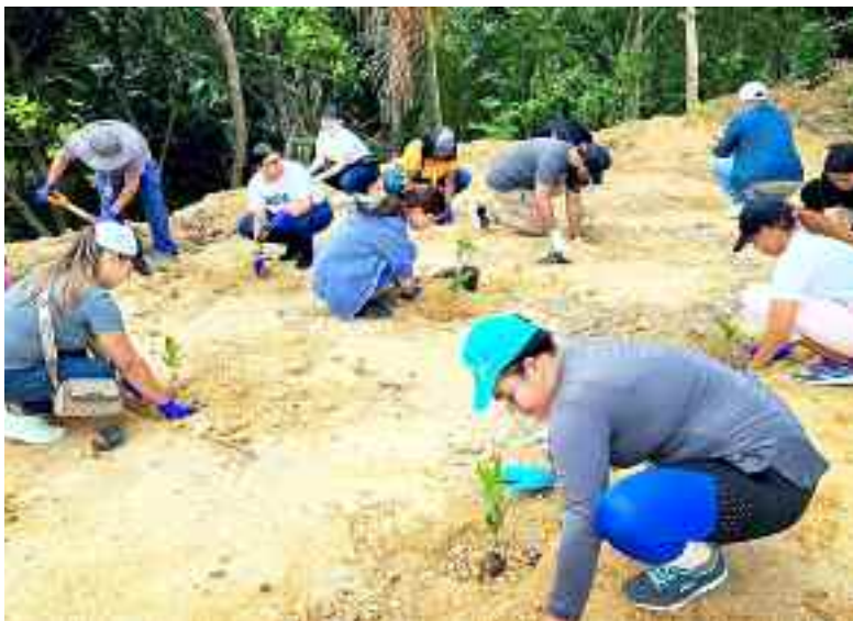
Miembros de la Sociedad Ecológica de Puñal y los estudiantes de la Universidad UAPA

Con motivo del Día Internacional de la Tierra, la Sociedad Ecológica de Puñal y los estudiantes de la Universidad UAPA, realizaron una jornada de reforestación para crear conciencia sobre el cuidado que debemos tener para cuidar el Planeta.