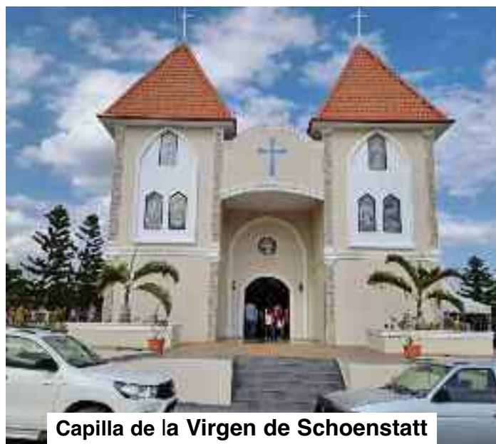
Capilla de la Virgen de Schoenstatt