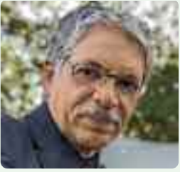
TEXTO Y FOTO: Juan Guzmán