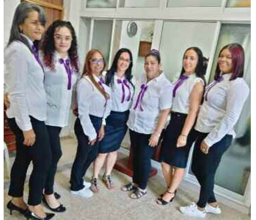
Parte del equipo organizador del Concierto Cuaresmal

Este Concierto Cuaresmal quedará grabado en todos los fieles que disfrutaron de una noche maravillosa donde se vivieron momentos de intimidad con Dios por medio de las canciones que elevaron nuestro espíritu hacia El.