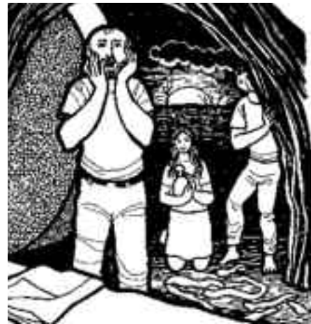
Dios resucitó a Jesús de entre los muertos

Quien cree, participa ya de la victoria de Jesús sobre la muerte y la maldad.