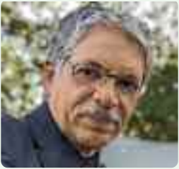
TEXTO Y FOTO: Juan Guzmán