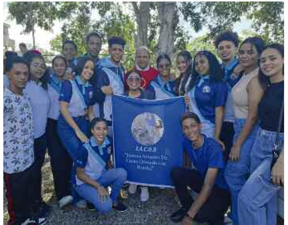
Jóvenes de la Pastoral Juvenil, parroquia Jesucristo Redentor de Matanzas, Santiago.

A nivel internacional han llevado su música a Los Ángeles, Hollywood, Las Vegas Nevada, Boston, Connecticut, New York, New Jersey, Miami, Orlando, Panamá, Honduras, Costa Rica, Guatemala, Chile, Ecuador, y Puerto Rico.