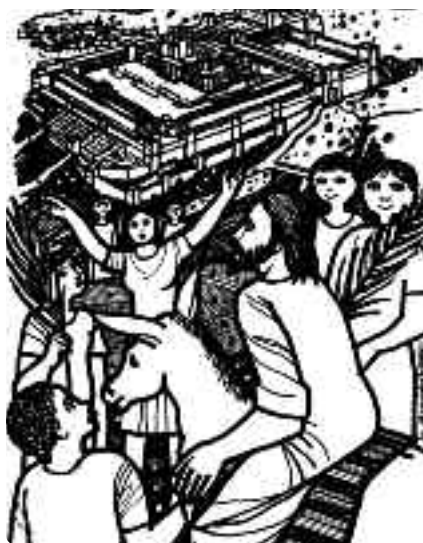
Lo saludaron con ramos, pero no cargaron la cruz.

Celebremos Semana Santa junto a nuestra parroquia para experimentar, cómo en la Pascua y en la vida, de la cruz brota la luz.