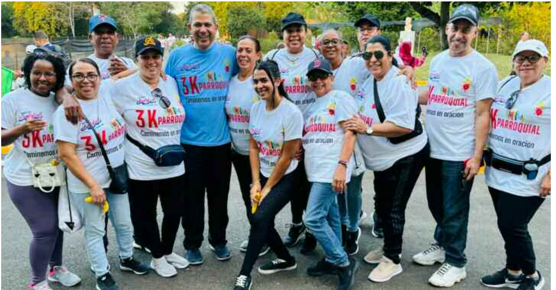
Mons. Tomás Morel con participantes del 3K Familiar Caminemos en oración para transformar la nación