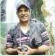
TEXTO Y FOTO: Juan Guzmán