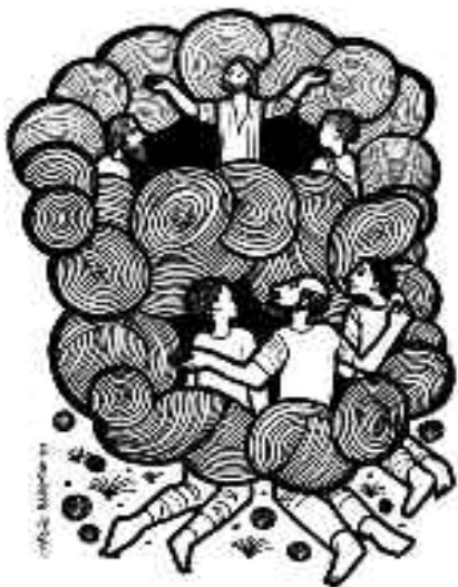
El Hijo no se quedó en la montaña, bajó a Jerusalén.

Entiéndase bien, Dios no mató a su Hijo, de eso nos encargamos nosotros. Lo que Pablo enseña, es que por nosotros, para que naciera desde adentro de la historia la posibilidad de “caminar en presencia del Señor” (Salmo 115), el Hijo de Dios vivió, creyó y murió en esta misma vida tramposa, fiado de la lealtad de Dios vencedor de la muerte. Esa fe nos salva.