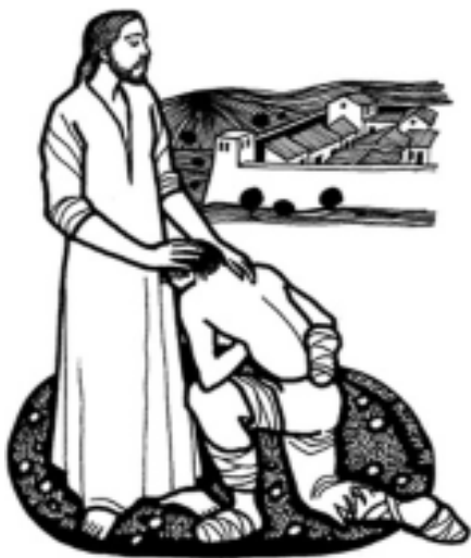
Lo tocó y le dijo: quiero: ¡sana!

nosotros los cristianos reconocemos en Jesús un poder que devuelve a la vida. Pero Jesús hace al leproso corresponsable de su curación. Usando el imperativo, convoca desde adentro del leproso sus mejores fuerzas al conminarle: ¡sana!