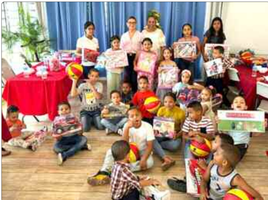
SANTIAGO.- Radio Jesús con los niños, es una de las varias actividades que realiza esta Emisora en beneficio de la comunidad.

Las crisis, la enfermedad tal vez quedar malherido despedir a un ser querido una infausta novedad llegar a la ancianidad el otoño de la vida historia que no se olvida de conocidos y extraños y si llegan nuevos años ¡les damos la bienvenida!