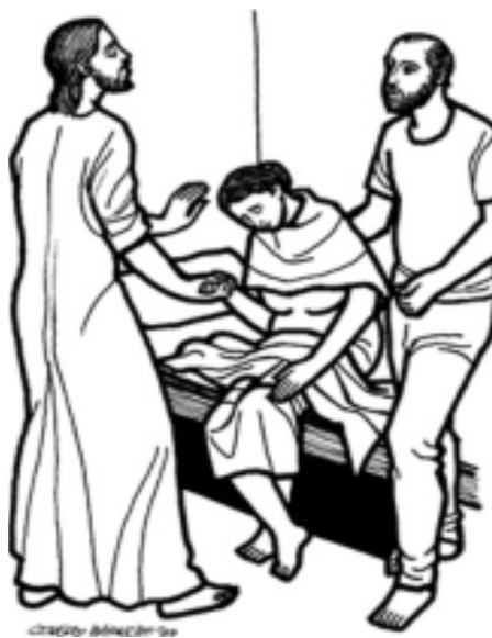
Jesús curó a la suegra de Pedro.

La oración, libró a Jesús de encadenarse a las expectativas de la gente, y lo capacitó para responder a su verdadera vocación.