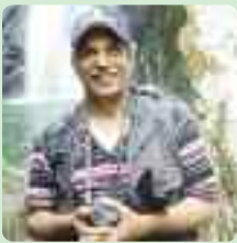
TEXTO Y FOTO: Juan Guzmán