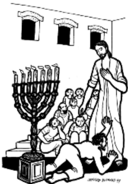
Jesús lo salvó del mal

criatura se erige en su propio Dios. A la base del mal está la mentira radical de afirmarnos, como si nosotros fuésemos nuestros propios creadores. Toda la creación y el universo se desquician cuando la criatura pretende ocupar el lugar del Creador.