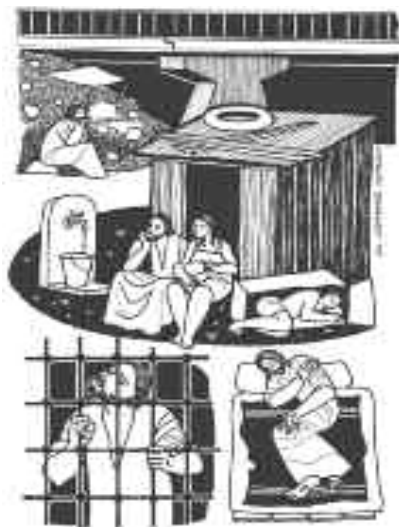
La puerta a la vida eterna: ¡servir!

Si de cada Padre Nuestro bien rezado se desprenden migas, pues adentro lleva un pan; de cada vida vivida como Jesús la propone, se desprenderá el compromiso espiritual y político contra la pobreza y de ñapa la vida eterna.