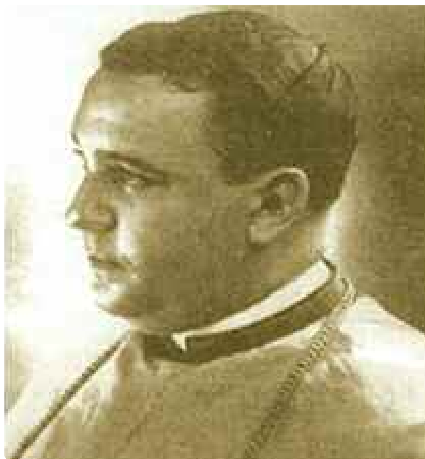
Octavio Antonio Cardenal Beras Rojas