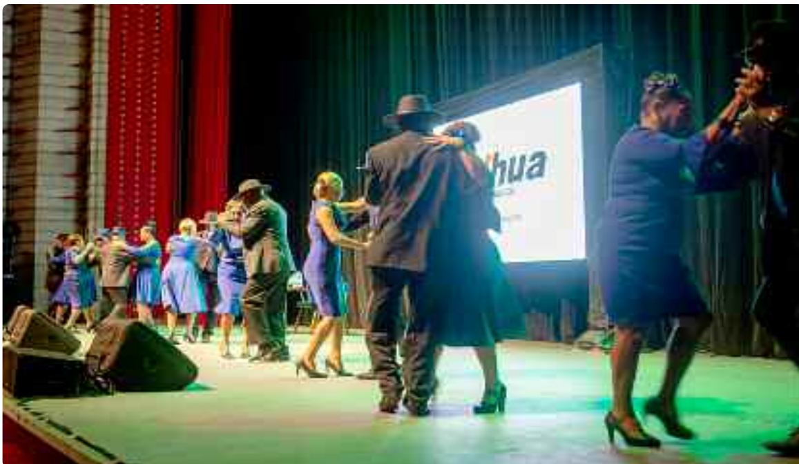
Integrantes de El Son de Keka, un patrimonio cultural de Santiago