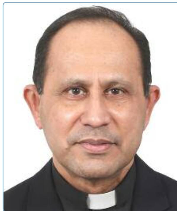
Mons. Jain Méndez, Encargado de Negocios, a.i., de la Nunciatura Apostólica en S.D.

Una vez que se casó, tuvo 10 hijos; y, con orgullo, afirmo que soy el décimo. El número de hijos tan numeroso, nunca la hizo desistir de su decisión. Aquí y ahora deseo recordar una cosa más: en aquella época, vivíamos en una isla. Para los estudios, teníamos que cruzar el río y caminar una hora para llegar a la escuela. En ese afán materno por educarnos de la mejor forma posible, durante las vacaciones de verano, en lugar de pasar largo tiempo jugando con otros niños, nos enviaba a la escuela de escritura mecanográfica. Seguramente ella habría intuido que, algún día,