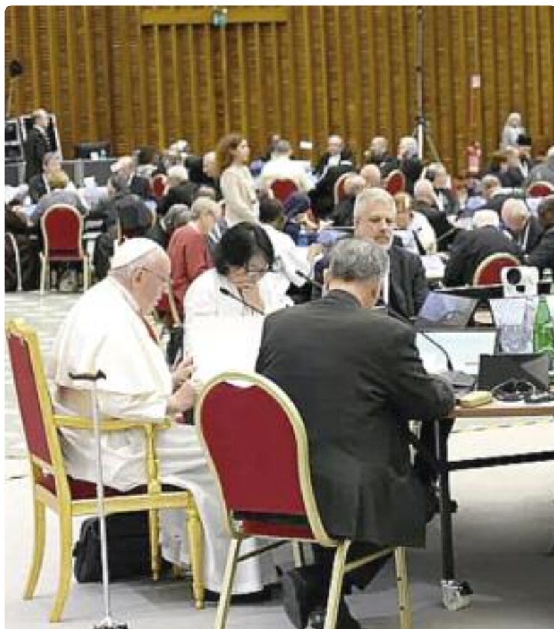
Papa Francisco en el Sínodo de la Sinodalidad.

En un discurso pronunciado en la 18ª Congregación General del Sínodo de la Sinodalidad, el Papa Francisco hizo una fuerte crítica al clericalismo en la Iglesia: “es un látigo, es un azote, es una forma de mundanidad que ensucia y daña el rostro de la esposa del Señor; esclaviza al santo pueblo fiel de Dios”.