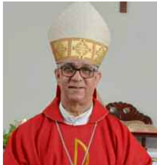
Mons. Héctor Rafael Rodríguez

Sé que sabrá poner a esta Iglesia en las actuales inquietudes que mueven a la Iglesia universal como la sinodalidad. Que caminemos juntos, principalmente pastor y grey, que sus preocupaciones sean las nuestras y que su finalidad no sean sus asuntos, sino los nuestros, sobre todo lo de los pobres y