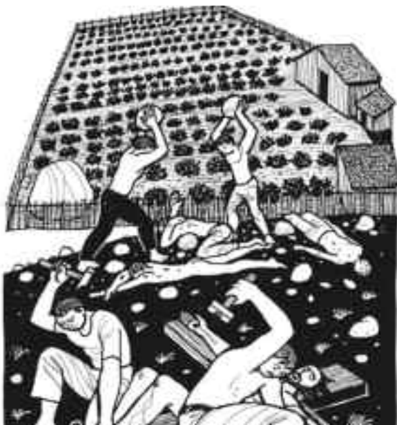
Pagaron con sus vidas sus denuncias

“¡Ánimo! Todo pasa. Ama tu trabajo y no dejes de cumplir tu deber cada día”, nos decía Don Bosco. Cumplamos nuestro deber cada día, cada hora, cada segundo, sin posposiciones, sin excusas, sin lamentos, sin miedos, sin reparos. “Cumplir” es un verbo hermoso. Aprendamos a conjugarlo como Dios manda.