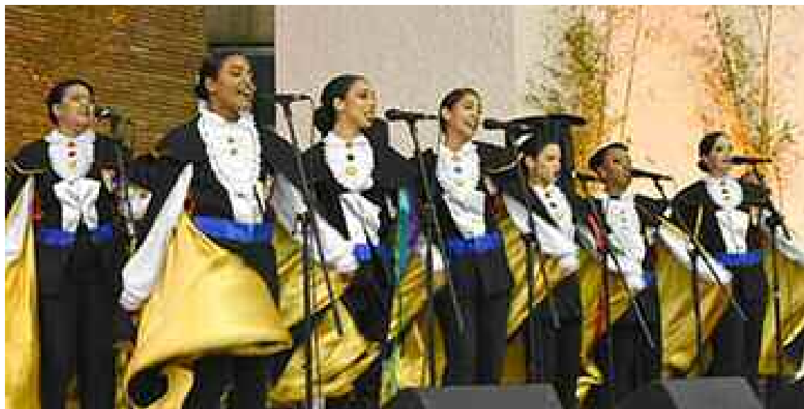
La Tuna de la PUCMM interpretó hermosas canciones.

- Coherencia de vida: 24/7. Vivir como cristianos en todos los ámbitos de la vida y permanentemente.