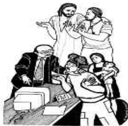
El perdón crea un nuevo comienzo.

En todo perdón hay un regalo, un don. Al perdonar le regalamos al perdonado el empezar de nuevo. En el evangelio (Mateo 18, 21 a 35), Jesús lo deja claro: quien perdona actúa igual que Dios. Quien no perdona de corazón a su hermano, se excluye a sí mismo del perdón. Después del perdón, perdurarán los sentimientos negativos, pero la actitud de desearle el bien a quien nos ha herido nos sana y nos salva, de seguro, a nosotros y pudiera hasta salvar al agresor.