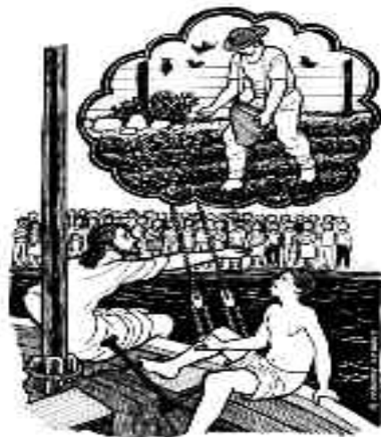
¡Salió el sembrador a sembrar!

Escucha: ¡ya el Sembrador salió a sembrar!