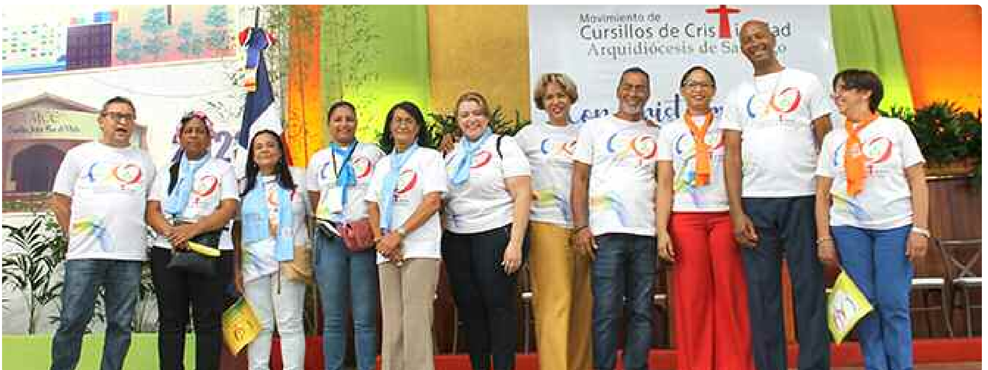
Nueva directiva Cursillos de Cristiandad, Santiago