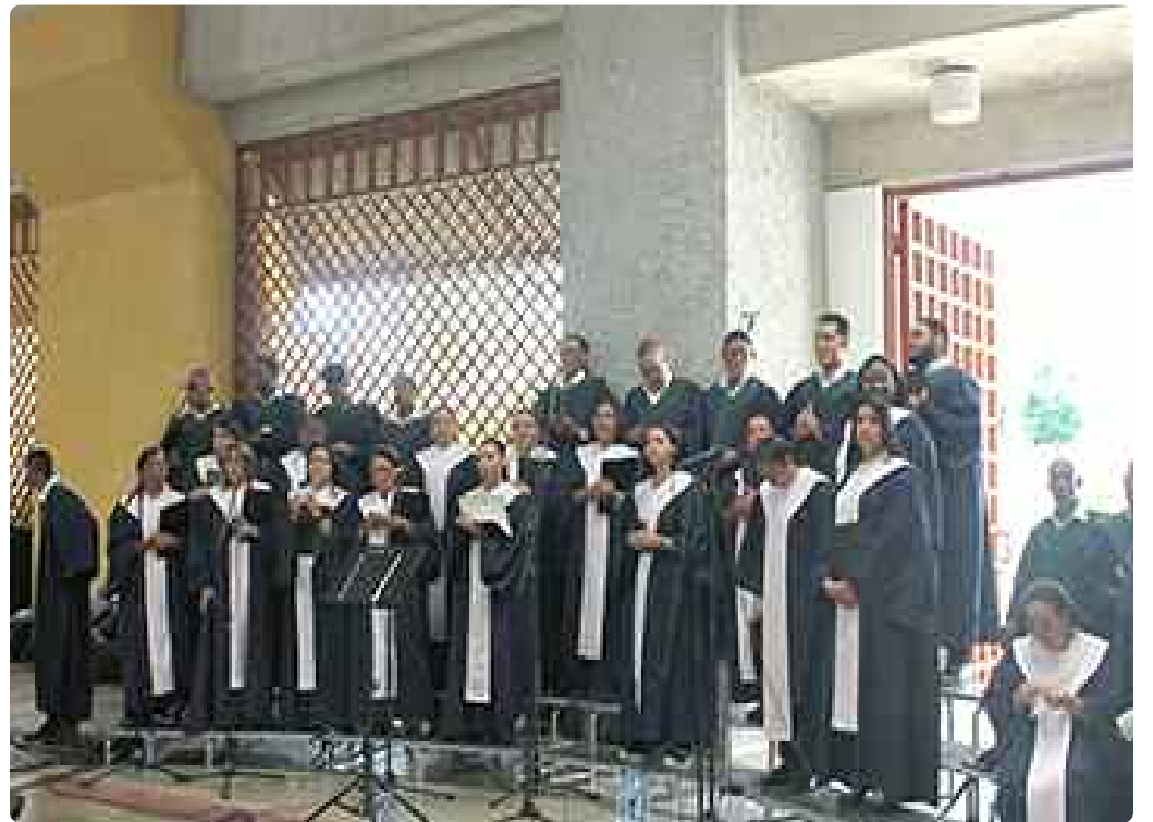
Coro Arquidiocesano de Santiago

po Auxiliar de la Arquidiócesis de Santo Domingo, y asesor nacional del Movimiento compartió una reflexión sobre los aportes que ha hecho a la Iglesia el Movimiento de Cursillos de Cristiandad.