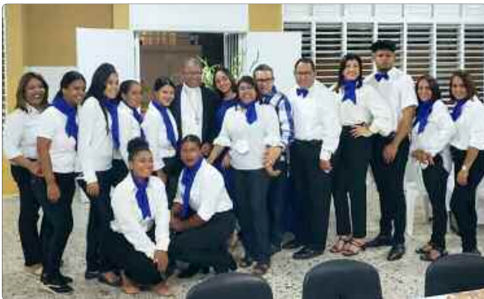
Equipo Organizador de Pan y Vino, Matanzas, Santiago.