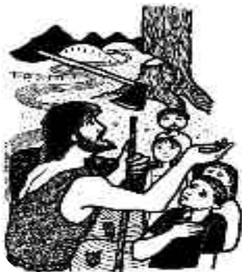
El árbol que no dé frutos de justicia será cortado.

Con el texto de Mateo 3,1-12, la Iglesia nos exhorta con Juan el Bautista: “conviértanse, porque está cerca el reino de los cielos.” La verdadera Navidad no necesita involucrarse en papel de regalos. Hay árboles que lucen hojas bellas, pero no producen frutos de justicia. ¡Esos serán cortados!