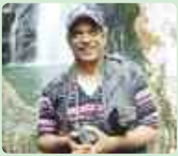
TEXTO Y FOTO: Juan Guzmán