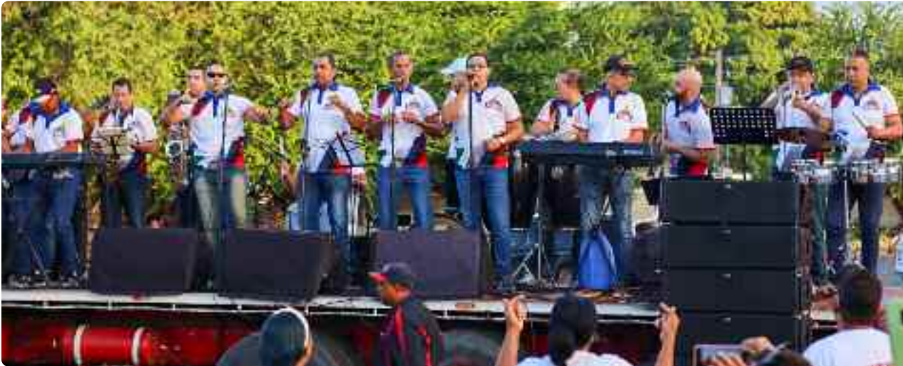
Sangre Renovada llevó alegría en cada una de sus canciones.

En Santiago una multitud caminó desde el Estadio Cibao para llegar al Parque Central. El entusiasmo era desbordante.