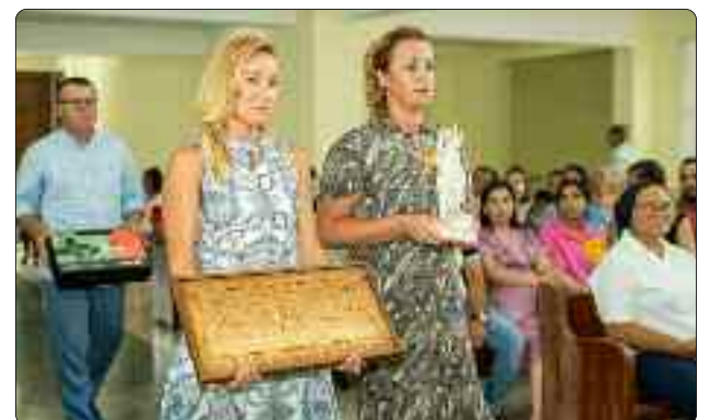
Delegación de Polonia