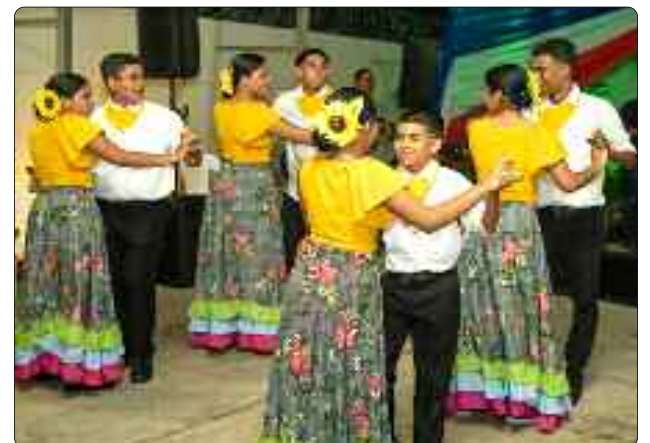
Grupo de Baile de Jánico