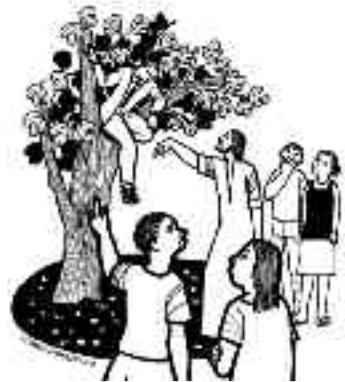
¡Zaqueo, baja; voy para tu casa!

Pero el incómodo Jesús de los Evangelios siempre quiebra nuestros esquemas excluyentes. Todo el mundo quiere actuar en nombre del absoluto, llámese “dios”, la patria, o el líder heroicamente palabre-